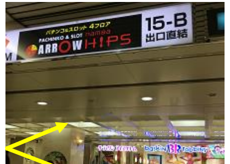
⑥「サーティワンアイスクリーム」が見えたら、左に進みます。