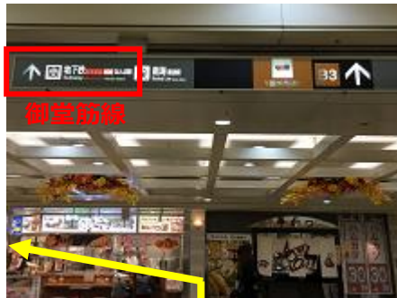
⑤地下鉄御堂筋線を目指して、「なんばウォーク」を左に進み、つきあたりまで直進します。