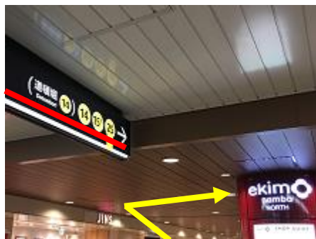
⑦「14 番出口」「15-B 番出口」を目指して、左に進みます。