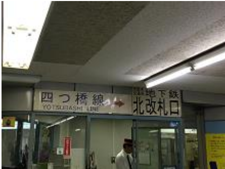
①地下鉄四つ橋線「なんば駅」北改札口より出ます。