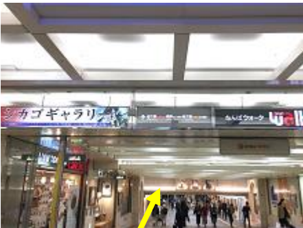
④「なんばウォーク」内、「シカゴギャラリー」を通り抜けます。