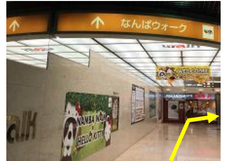
③「なんばウォーク」を通って、地下鉄御堂筋線を目指して右に進みます。