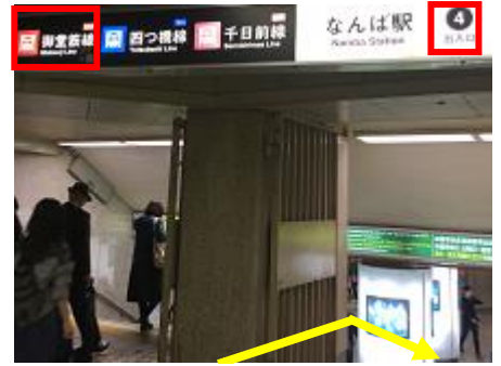
⑤「4 番出入口」階段を下り、地下鉄御堂筋線を目指して進みます。