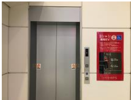
⑩エレベーターで地上へ上がります。