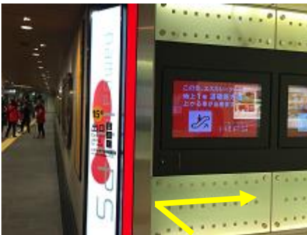
⑨「namba HIPS」直結の「15-B 番出口」に向かって、右に進みます。