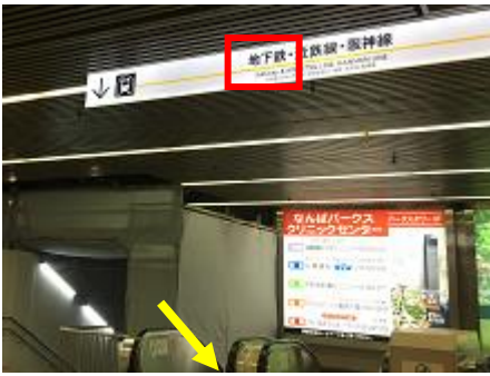
③地下鉄方面を目指して、エスカレーターで B1 階に下ります。