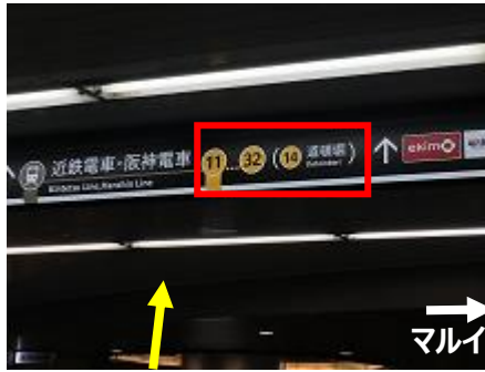
⑦「マルイ」を右手に、「ekimo South ゾーン」を通過して、「14 番出口」「15-B 番出口」を目指します。