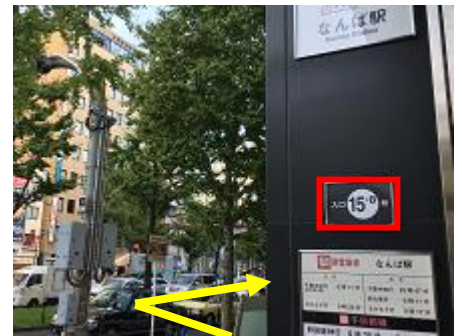
⑪地上へ出た後、車の走行方向とは反対の方向に御堂筋を直進します。 ※ホテルはこの御堂筋沿いです※