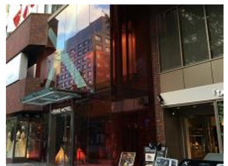
⑭赤いエントランスが目印、クロスホテル大阪へようこそ！