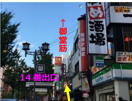
⑫「14 番出口」を通り過ぎ、そのまま御堂筋を北の方角へ直進します。