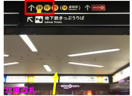
⑧御堂筋線北東改札を左手に、「ekimo North ゾーン」を通過して、「15-B 番出口」を目指します。