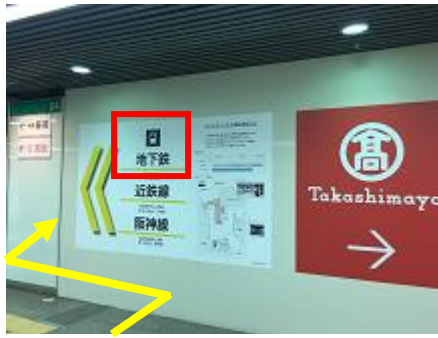
④高島屋を右手に、地下鉄方面へ左に進みます。