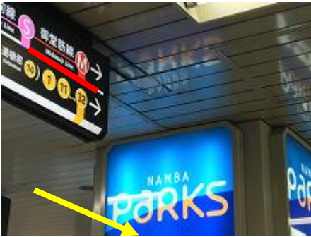
⑥御堂筋線・「14 番出口」を目指して進みます。