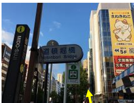
⑬「道頓堀橋」を越えたら、もうすぐです！